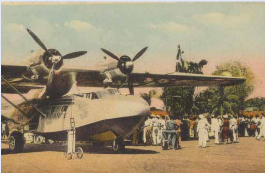
Pointe à Pitre le 21 Février 1950, inauguration de la piste du Raizet par le président Gaston Monnerville.