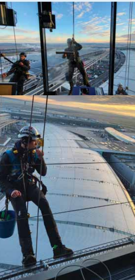
© Younes Jaouad, Technicien Coordination Centralisée Air France.

● Source : Communication interne Air France