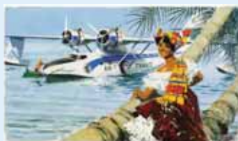
Un « Catalina » du réseau des Antilles