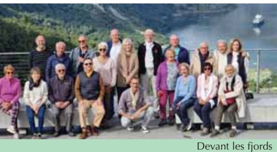
Devant les fjords

Nous longeons également plusieurs glaciers et faisons un arrêt au Boyabreen.