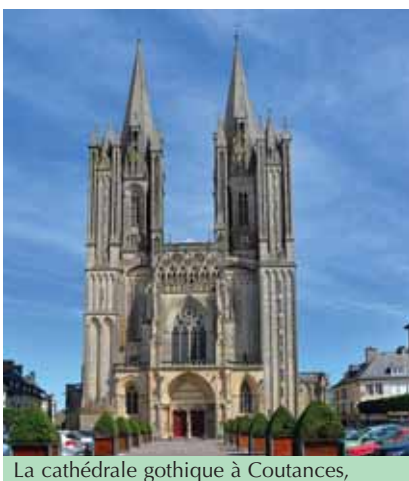
La cathédrale gothique à Coutances,